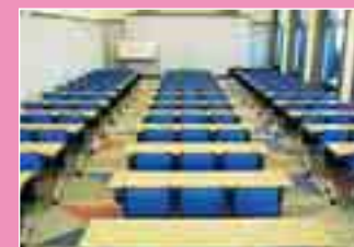
ホワイトホール (117名用)